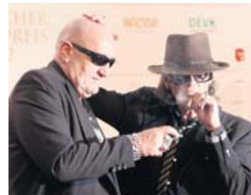
Ehemalige Freunde: Eddy Kante und Udo Lindenberg

das vorstellen kann.“ Seit dem 1. September ist seine Biografie „In meinem Herzen kocht das Blut“ (Schwarzkopf & Schwarzkopf, 320 Seiten, 19,95 Euro) im Buchhandel – wegen des Buches hatte er sich mit seinem Freund und Arbeitgeber Udo Lindenberg zerstritten. (dsa)